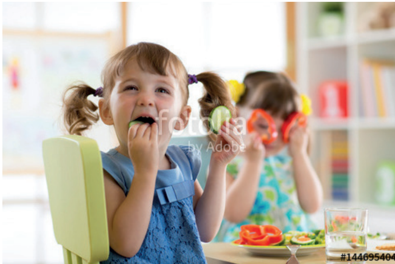
Die Staatliche Grundschule Schöndorf erhielt finanzielle Unterstützung unserer Stiftung „Rund ums Wohnen“ um Kindern eine warme Mittagsmahlzeit zur Verfügung stellen zu können.