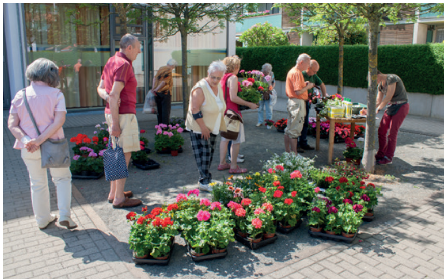
Viele Mieter aus Weimar Nord nutzten die Möglichkeit, die Blumen der Gärtnerei Welzel direkt vor Ort zu erwerben.