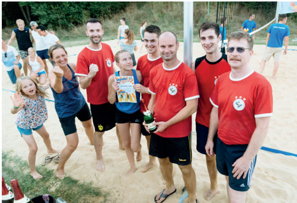
Auch in diesem Jahr spielt die GWG-Volleyballmannschaft um den Pokal zum Familien- und Sportfest unserer Genossenschaft am 9. September 2017.

„Damit das Mögliche entsteht, muss immer das Unmögliche versucht werden“